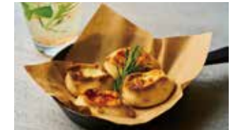
ピッコリピッツア