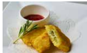
ELFER Potato Stricks