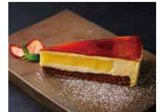
Today' s Special