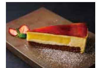
本日のケーキ (一例)