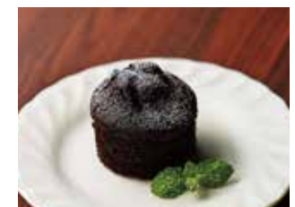
フォンダンショコラ