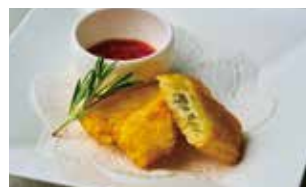
エルファーパーポテト