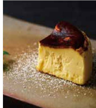
Today' s Special