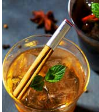
〈Hotel Original〉 Craft Ginger Craft Cola